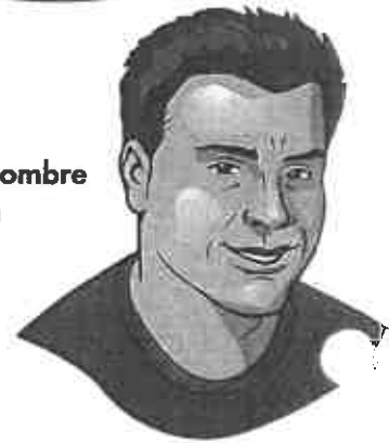
el hombre man