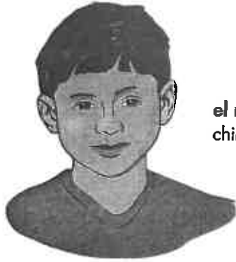
el niño child (m)