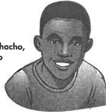
el muchacho, el chico boy