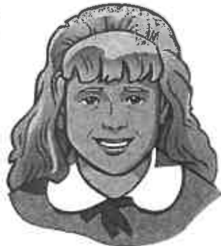
la niña child (f)