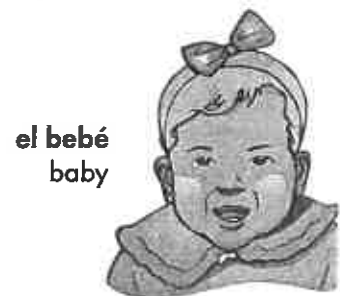
el bebé baby