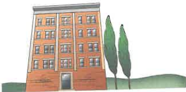
el edificio de apartamentos