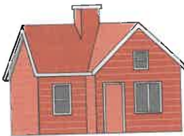
la casa particular